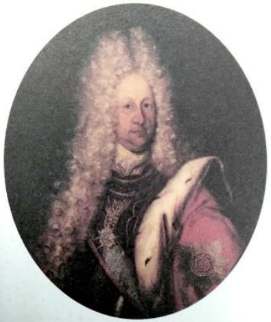
Неизвестный художник «Портрет Б.П. Шереметева»

Своих офицеров Пётр стал «выращивать» из бывших «потешных» полков: Преображенского и Семёновского (от названий близлежащих к Москве сёл). Ввели обязательную военную службу и для дворян.