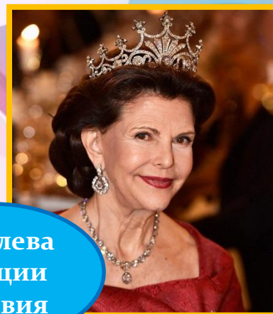
Королева Швеции Сильвия