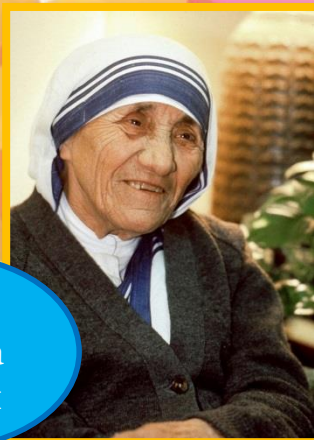
Мать Тереза Элени